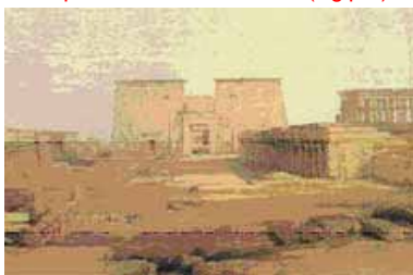
Templo de la Isla de Philae (Egipto)

Regresando a la religión ancestral, el Temple aspiraba a la abolición total de las guerras, de las desigualdades y a la extirpación del odio predicado por las religiones. Pretenderían instaurar la sinarquía, el reino de la razón, de la caridad, del amor. En definitiva, el Reino de Dios de las profecías bíblicas. *