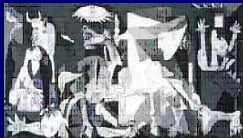
La violencia solo engendra más violencia

Siram Abif , más que un mito o leyenda, es un paradigma de genialidad, perseverancia, racionalidad y humanismo, que debería ser un ejemplo a seguir, no una exaltación al mito o leyenda, ni culto a la personalidad.