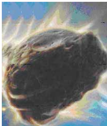
Un asteroide puede colisionar con la tierra

La Organización de Naciones Unidas (ONU), ha decidido redactar, en el curso de este año, el borrador de un documento que defina con toda claridad qué es lo que debería hacerse en el caso de que un asteroide avanzara hacia un curso de colisión directa con nuestro planeta.