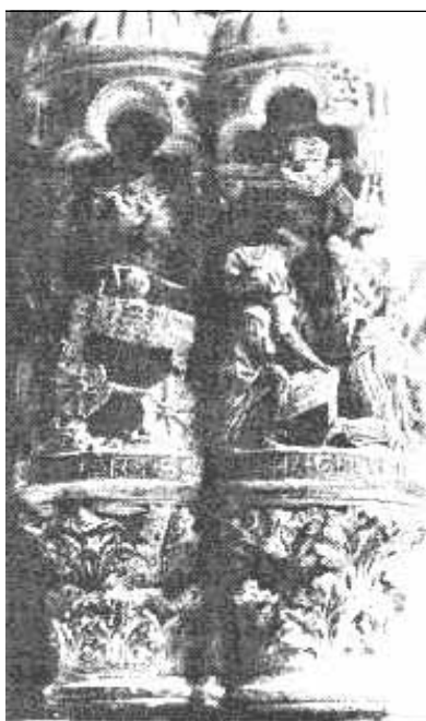
Una de las doble columnatas que adornan la misteriosa catedral de Chartres

Aparte de la Catedral francesa, merece un puesto de honor la Abadía de Rosslyn, en Escocia, cercana a Edimburgo. Después de la disolución de la Orden del Temple, entre 1307 y 1314, muchos de los supervivientes se trasladaron a Escocia, y Rosslyn fue el último reducto templario. Algunos eminentes investigadores sospechan que podría ser el emplazamiento definitivo del Arca de la Alianza que los Templarios habrían llevado y escondido allí, junto con sus otros tesoros, nunca hallados.